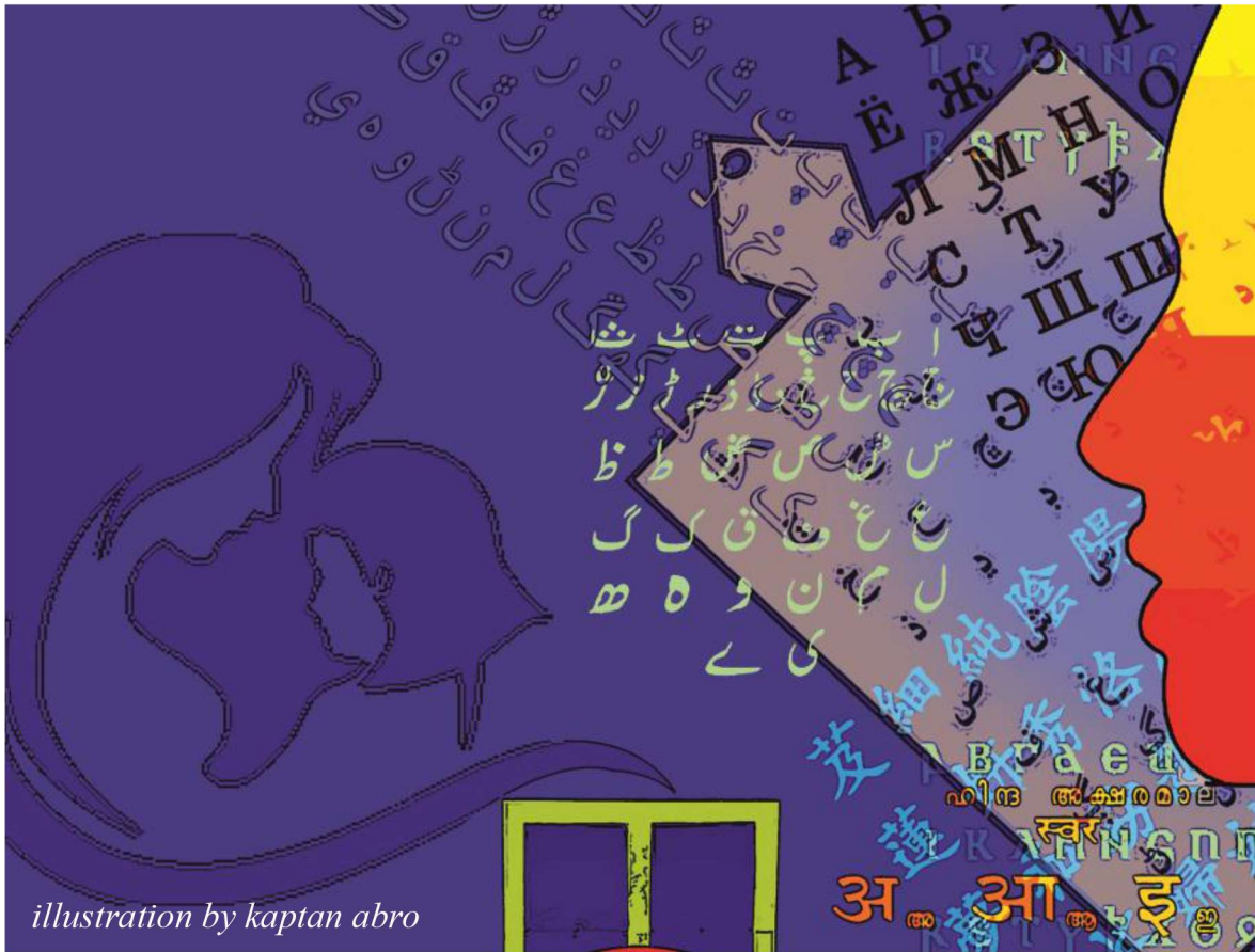
illustration by kaptan abro

ويدڪ دور کان پوءِ هٿو مت جي ڏند ڪٿائي دور (Epic period) جي ڪهاڻين ۾ سنڌي ٻوليءَ جا لفظ ملن ٿا. اهو دور اٽڪل 800 ق. م کان 600 ق. م ڄاڻايو ويو آهي. 600 ق. م کان پوءِ ٻئي يا ٻيڻي سنسڪرت جو گرامر لکيو، جنهن ۾ به سنڌي ٻوليءَ جا لفظ موجود آهن. محققن جو چوڻ آهي ته ٻيڻي سنڌي هو، جنهن جي نسلي نسبت ويدڪ دور جي ٻئي لوڪن سان هئي. ٻيڻي سنڌي هو، پر سنسڪرت درباري يا مٿئين طبقي جي ٻولي هئي، جنهنڪري سنسڪرت جو گرامر لکيائين. ممڪن آهي ته هن سنڌي ٻوليءَ ۾ به ڪجهه لکيو هجي، پر وقت ۽ حالتن جي الٽ پلٽ ۾ اهو مواد گم ٿي ويو هجي. سنسڪرت دربار جي جهول ۾ ۽ سنڌي ٻولي عوام جي جهول ۾ پلجندي ۽ نهجندي رهي. سنڌي ٻولي